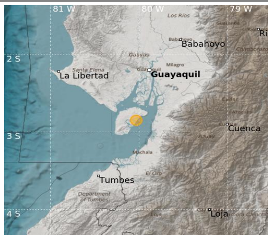
Mapa B. Localización de eventos en la zona del golfo.

Según reporte del IG-EPN, el evento telúrico suscitado a las 00h35 del 25/04/2023 tuvo su epicentro a 36 km en dirección noreste de la Isla Puna, del cantón Balao, en la provincia del Guayas, de magnitud 5.7 (Mlv), a una profundidad de 60 km.