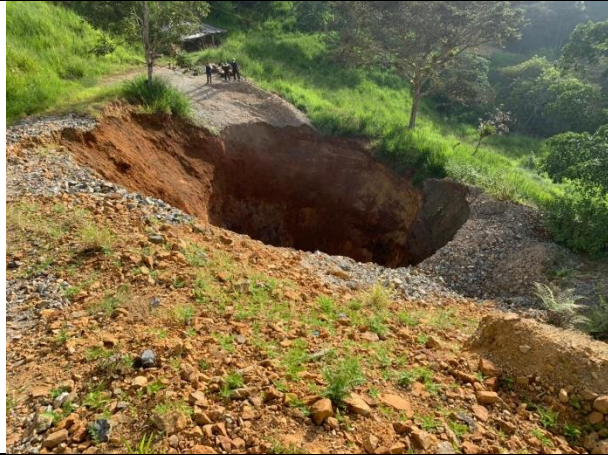
Hundimiento en el Sector Gonzalo Pizarro