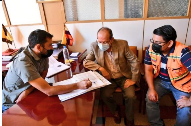
Reunión Con Alcalde de Zaruma y Gobernador de El Oro