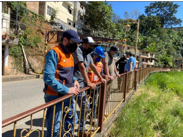
Monitoreo con Alcalde de Zaruma