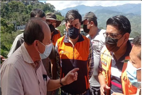
Recorrido con Gobernador de El Oro