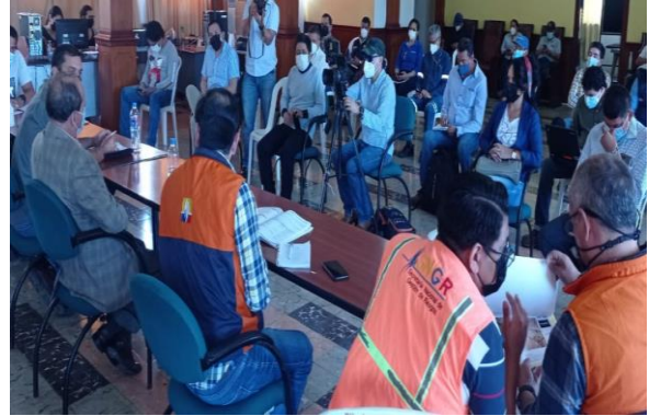
Reunión de COE Cantonal Zaruma