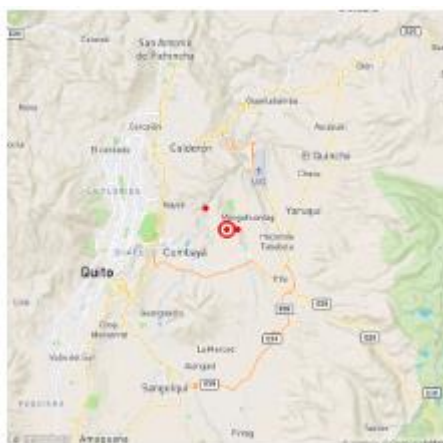
Figura 1.a. Mapa de Localización del evento registrado el día de hoy 23 de noviembre de 2021 a las 11h03 (TL), con una magnitud de 4.6 MLv a una profundidad de 12 km.

El día martes 23 de noviembre de 2021 a las 11h03 TL, se registró un sismo de magnitud 4.6 MLv, cuyo epicentro se localiza a 3 km al sur-oeste de Puenbo, Pichincha-Ecuador.