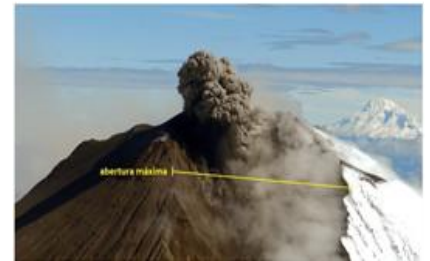
Imagen Nro. 01 Fotografía de deformación tomada en sobrevuelo 24/06/2020

Durante el actual período eruptivo del volcán Sangay, los cambios morfológicos han sido evidentes. El principal cambio está asociado a la erosión en el flanco suroriental, que ha dado lugar a la formación de una amplia quebrada por la cual se encauzan los flujos de lava y los flujos piroclásticos, asociados al colapso de los frentes de flujos de lava.