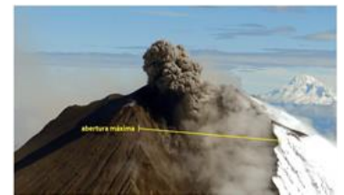
Imagen Nro. 01 Fotografía de deformación tomada en sobrevuelo 24/06/2020

Durante el actual período eruptivo del volcán Sangay, los cambios morfológicos han sido evidentes. El principal cambio está asociado a la erosión en el flanco suroriental, que ha dado lugar a la formación de una amplia quebrada por la cual se encauzan los flujos de lava y los flujos piroclásticos, asociados al colapso de los frentes de flujos de lava.