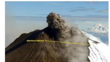
Imagen No. 01 Fotografía de deformación tomada en sobrevuelo 24/06/2020

Durante el actual período eruptivo del volcán Sangay, los cambios morfológicos han sido evidentes. El principal cambio está asociado a la erosión en el flanco suroriental, que ha dado lugar a la formación de una amplia quebrada por la cual se encauzan los flujos de lava y los flujos piroclásticos, asociados al colapso de los frentes de flujos de lava.