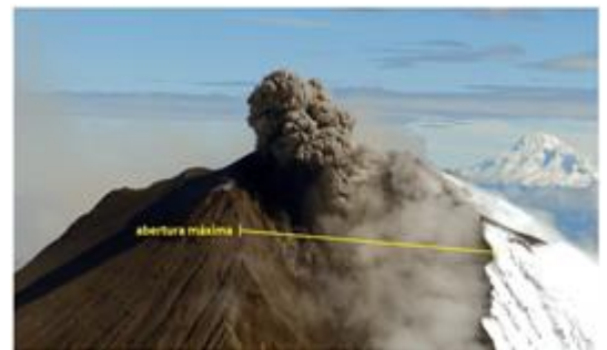
Imagen Nro. 01 Fotografía de deformación tomada en sobrevuelo 24/06/2020

Durante el actual período eruptivo del volcán Sangay, los cambios morfológicos han sido evidentes. El principal cambio está asociado a la erosión en el flanco suroriental, que ha dado lugar a la formación de una amplia quebrada por la cual se encauzan los flujos de lava y los flujos piroclásticos, asociados al colapso de los frentes de flujos de lava.