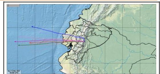
Fig. 1. Trayectoria del viento prevista en los distintos niveles de altitud para las 13H00 del domingo 14 de marzo 2021.

De acuerdo al Boletín especial del VOLCAN SANGAY No. 007 del INAMHI emitido con fecha 14/3/2021. En base al análisis de configuración de vientos, se estima que la trayectoria del viento proyectada en los niveles próximos al cráter del volcán se dirige hacia el Oeste entre los 5000 y los 7000 msnm y hacia el Suroeste entre los 9000 y 11000 msnm, por lo que en caso de dispersión, la ceniza tomaría esa trayectoria.