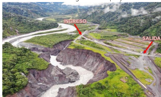
Fotografía 4. Foto aérea de la variante vial con una longitud aproximada de 650 metros

MTOP se encuentra avanzando en la construcción de la variante vial, el diseño definitivo contempla el problema de río Marker. La red vial estatal E45, vía Baeza-Lago Agrío, sector San Rafael, km 67, fisuras en la infraestructura, vía habilitada las 24 horas por la variante provisional. Se recomienda circular con precaución. A la fecha tiene un avance general del proyecto del 99%.