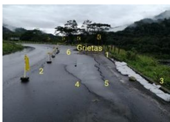
Fotografía 2. Referencia de grietas en la vía, sector río Montana.

El 20/07/2020 se produjo un nuevo deslizamiento que represó parcialmente el río Coca, el mismo que en breves minutos continuó con su cauce normal. GAD Municipal El Chaco, OCP y Petroecuador monitorean en el sitio.