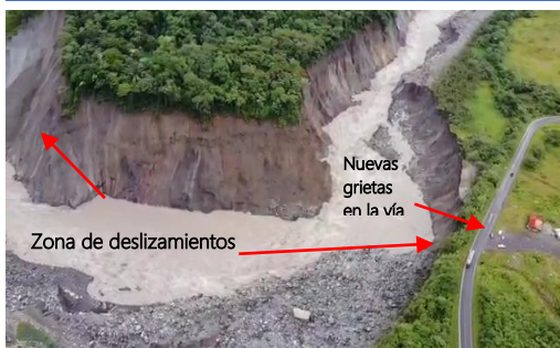
Fotografía 1. Referencia de nuevas grietas en la vía, fuente: Petroecuador