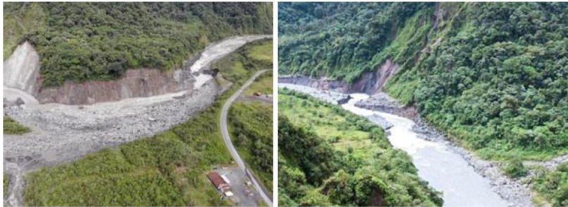
Fotografía 3. Comparativo erosión regresiva.

CELEC continúa con el registro y cálculo de los caudales diarios del río Coca, basados en la bitácora de operación, de las obras de captación, teniendo como caudal máximo medio superior a los 2.000 m 3 /seg el día 15/07/2020.