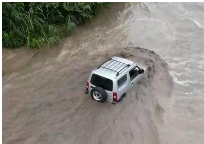
Imagen 4. Vehículo arrastrado por la corriente