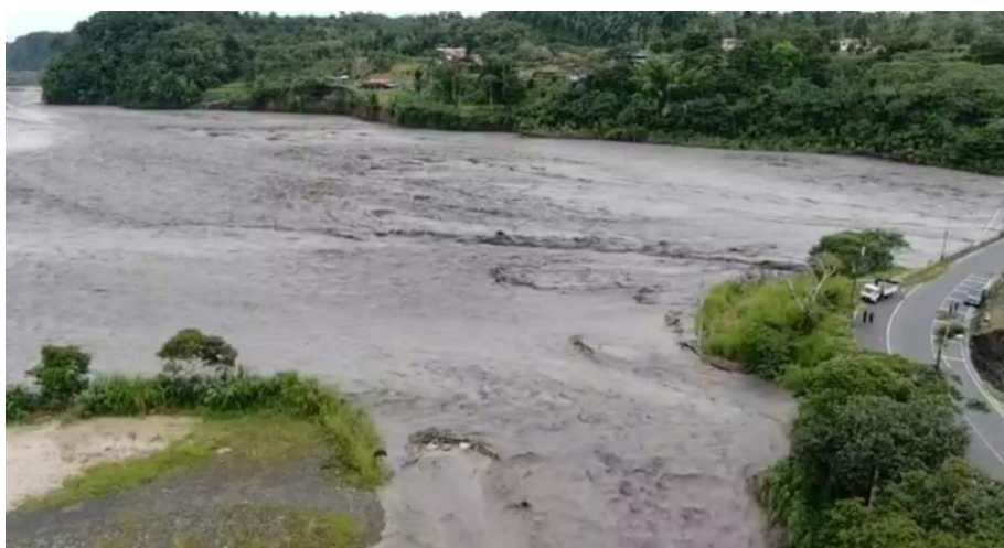
Imagen 1. Desbordamiento del río Upano

La acción erosiva del caudal del río Upano ha generado el socavamiento y la pérdida total de la calzada en un tramo aproximado 100 metros lineales, interrumpiendo el tránsito vehicular en su totalidad, así como también la pérdida de un poste de alumbrado público en donde se encuentra cableado de energía eléctrica, una cámara del SIS-ECU911 y telecomunicaciones.