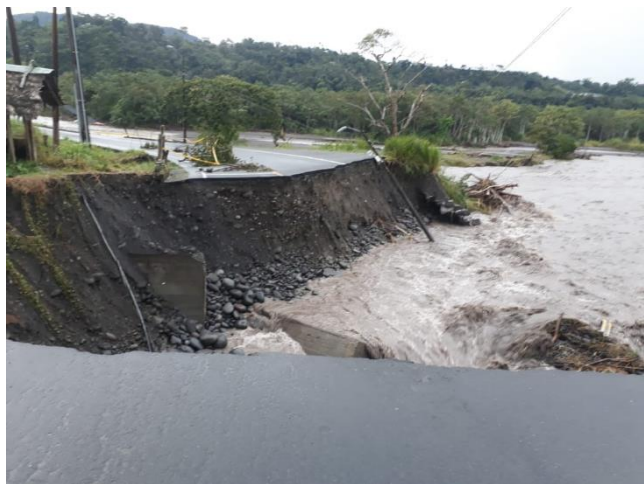
Imagen 3. Socavamiento actual de la vía

Un vehículo particular que se encontraba en las playas del río, fue alcanzado y arrastrado por la creciente, sin embargo, en su interior no se encontraban personas. Adicional al momento se encuentra en riesgo, maquinaria y equipos pertenecientes a la planta trituradora del GAD-Provincial de Morona Santiago, por tal motivo se encuentran tomando las medidas preventivas correspondientes.