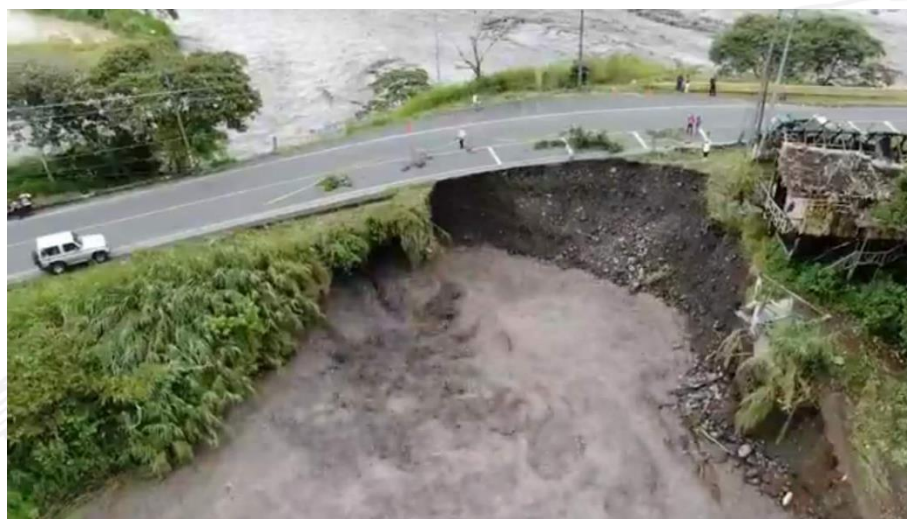
Imagen 2. Socavamiento inicial de la vía Macas-Puyo [E45] a la altura del puente sobre el río Upano