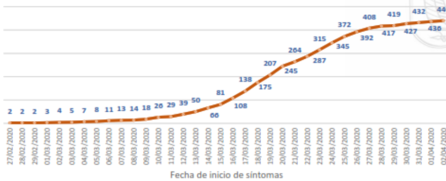
Línea de tendencia acumulada - PICHINCHA