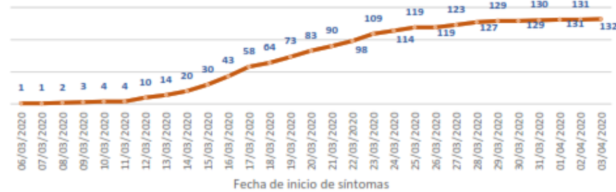
Línea de tendencia acumulada - MANABÍ