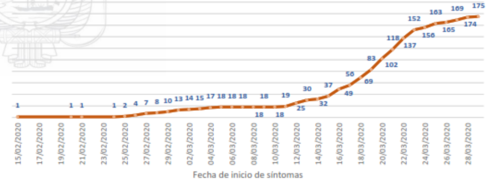
Línea de tendencia acumulada - LOS RÍOS