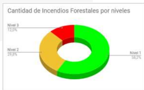
Tabla 2: Número de incendios forestales por niveles de afectación

Nivel 1 = afectación menor a 2 hectáreas Nivel 2 = afectación mayor o igual a 2 y menor a 10 hectáreas Nivel 3 = afectación mayor o igual a 10 hectáreas