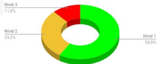
Cantidad de Incendios Forestales por niveles

Nivel 1 = afectación menor a 2 hectáreas Nivel 2 = afectación mayor o igual a 2 y menor a 10 hectáreas Nivel 3 = afectación mayor o igual a 10 hectáreas