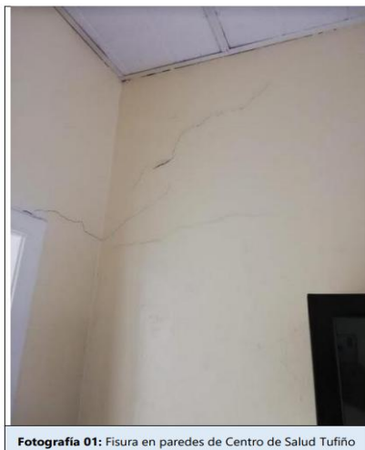
Fotografía 01: Fisura en paredes de Centro de Salud Tufiño