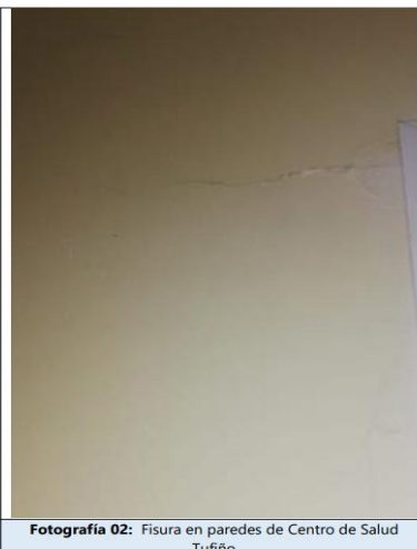
Fotografía 02: Fisura en paredes de Centro de Salud Tufiño