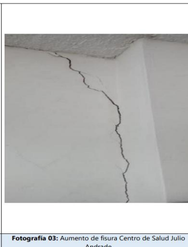
Fotografía 03: Aumento de fisura Centro de Salud Julio Andrade