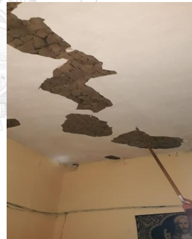
Fotografías: Afectaciones en Viviendas parroquia Tulcán.