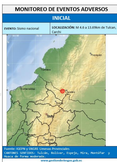
Fig:01 Mapa ubicación del evento

En la madrugada de hoy a las 01h24 TL se registró un sismo tectónico de magnitud MLv 4.6 (Mw 4.8), cuyo epicentro se ubicó al sur-suroeste de la ciudad de Tulcán en la provincia de Carchi a 4.9 km de profundidad. Entre la 01h00 y 06h00 de esta madrugada, se han localizado 56 eventos en esta zona y en total se han contabilizado unos 300. Estos eventos son de magnitudes entre 0.8 y 3.8, y con profundidades menores a 11 km. La réplica más grande (MLv 3.8) ocurrió a la 01h49 TL. Estos dos eventos principales se registraron claramente en los sensores sísmicos del lugar, y ambos fueron sentidos en la ciudad de Tulcán, la parroquia de Tufiño, y zonas aledañas.