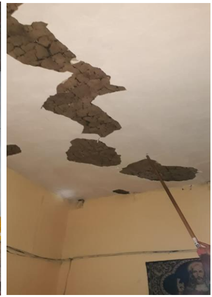
Fotografías: Afectaciones en Viviendas parroquia Tulcán