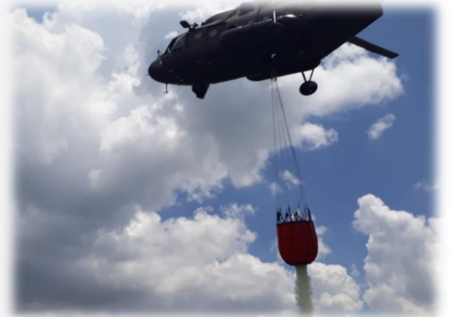
Fotografías: Equipo de intervención en el flagelo del Cerro Atacazo Fuente: FFAA, MAE