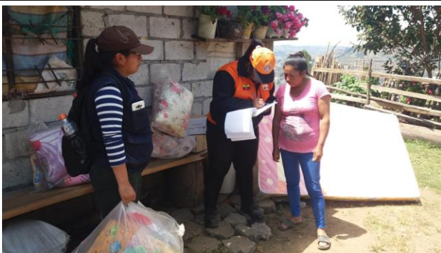
Foto 1: Entrega de ayuda humanitaria Localidades La Florida y Castillo a la Cruz, Chillanes