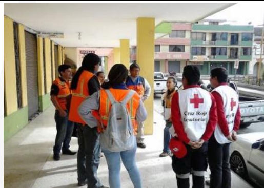
Foto 8: Equipo interinstitucional realiza la evaluación de daños a familias e infraestructura en San Miguel, 15/09/2018