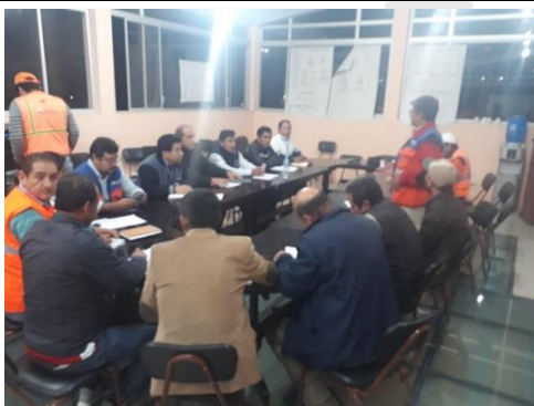
Foto 7: Reunión para la socialización de lineamientos del Plan de Respuesta para la transferencia del mando de la SGR al GAD Cantonal, 12/09/2018