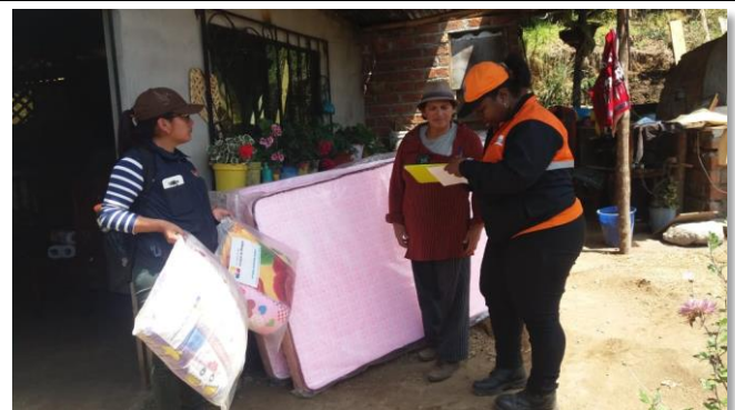
Foto 2: Entrega de ayuda humanitaria Localidades La Florida y Castillo a la Cruz, Chillanes