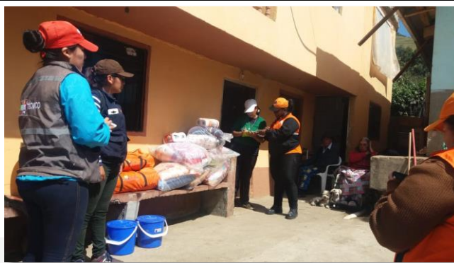
Foto 4: Entrega de ayuda humanitaria Localidades La Florida y Castillo a la Cruz, Chillanes