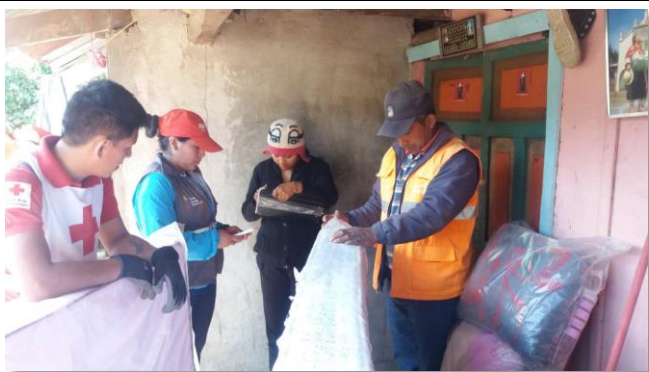
Foto 3: Entrega de ayuda humanitaria Localidades La Florida y Castillo a la Cruz, Chillanes

Fecha y Hora de actualización: martes, 18 de septiembre de 2018 - 16:54:32