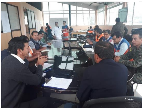
Foto 5: Reunión interinstitucional lidera por el Gobernador de Bolívar. Coordinación de acciones para evaluación de infraestructura con el apoyo de la Universidad Técnica de Ambato